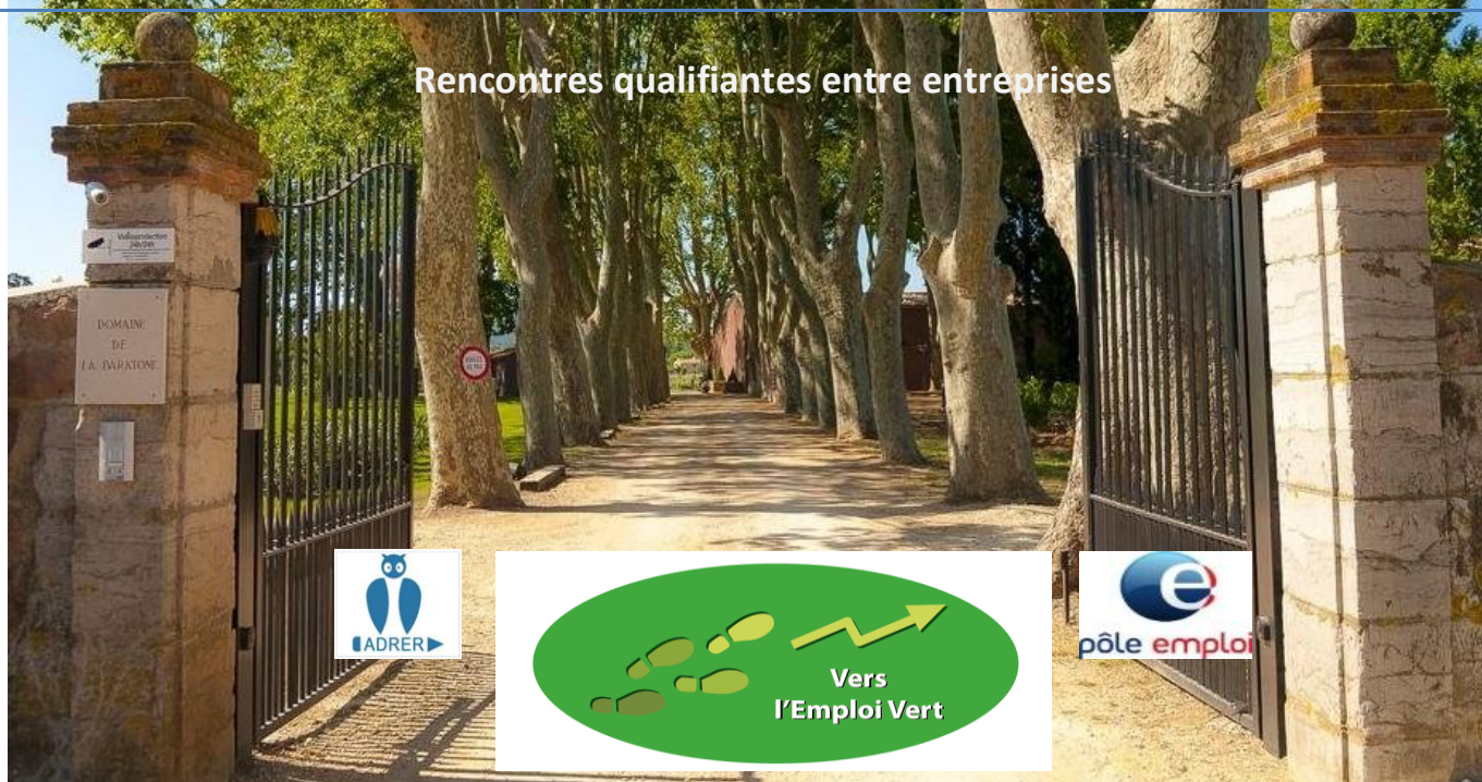
Domaine de la Baratonne

Rencontres qualifiantes entre entreprises